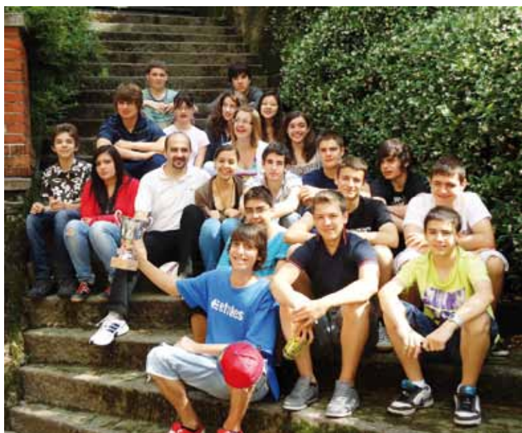
I licenziati dell'anno 2010-2011.

per tutti quella consegna, quel passaggio, quella carità. Un'intuizione divenuta storia. Nella scuola si educa insegnando. Si introduce il soggetto a rendersi conto della grandezza, della bellezza, della concretezza, della positività gratuita del mondo intero. Si cammina insieme affrontando l'avventura della conoscenza e della crescita umana. Si impara a dare un nome alle cose e si riconosce il valore assoluto dell'io, in un incontro tra libertà, tra persone, che si stimano al di là di ogni contingenza. La mostra fissa, a mo' di appunti, tracce di questa vita ventennale. Presenta questa esperienza attraverso volti, luoghi, soggetti, situazioni che, per quanto particolari e circostanziati, possono parlare a chiunque, perché l'esperienza che propongono è ciò che ognuno desidera per sé: un'apertura ad un orizzonte più grande di cui le cose particolari vibrano e a cui rimandano, un'oltre presente nel dato, cui tendiamo proprio se su quel dato ci chiniamo con tensione, con onestà, con tenacia e passione. Con amore.